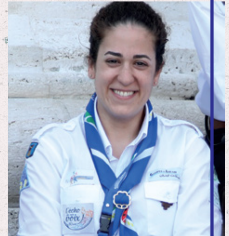
Commissaire Générale Joëlle Nehmé

"C'est la nuit qu'il est bon de croire en la lumière."